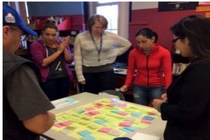
La comunidad escolar de la escuela primaria Spry en Chicago, IL, se divide en grupos pequeños para identificar temas comunes.

Luego, brinde a cada grupo la oportunidad de compartir sus temas emergentes y las palabras o frases recurrentes.